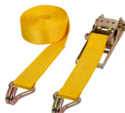
Sangle d'arrimage pour poids lourds de 8m force de traction direct 5T Réf : 37190 69.99 € HT