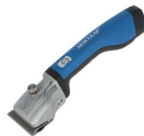
Tondeuse Aesculap Bonum bovin, avec 2 batteries au Li-Ion et un jeu de peigne Réf : GT646-BL 465.00 € HT