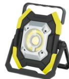
Projecteur LED sur batterie de 30W, batterie Li-ion Réf : 345608 62.99 € HT