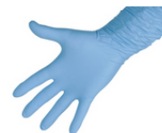
Gants à usage unique Nitrile Premium - Taille S au XXL Réf : 15325 à 15329 15.99 € HT