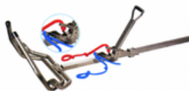
Véleuse Vink vache 200cm avec traction alternative Réf : A800 2m 469.00 € HT