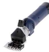
Tondeuse Farmclipper pour ovins avec 2 batteries au Li-Ion, et un jeu de peigne Réf : 18262 349.00 € HT