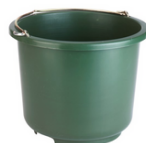
Seau pour niche Kerbl Réf : 29881 6.99 € HT